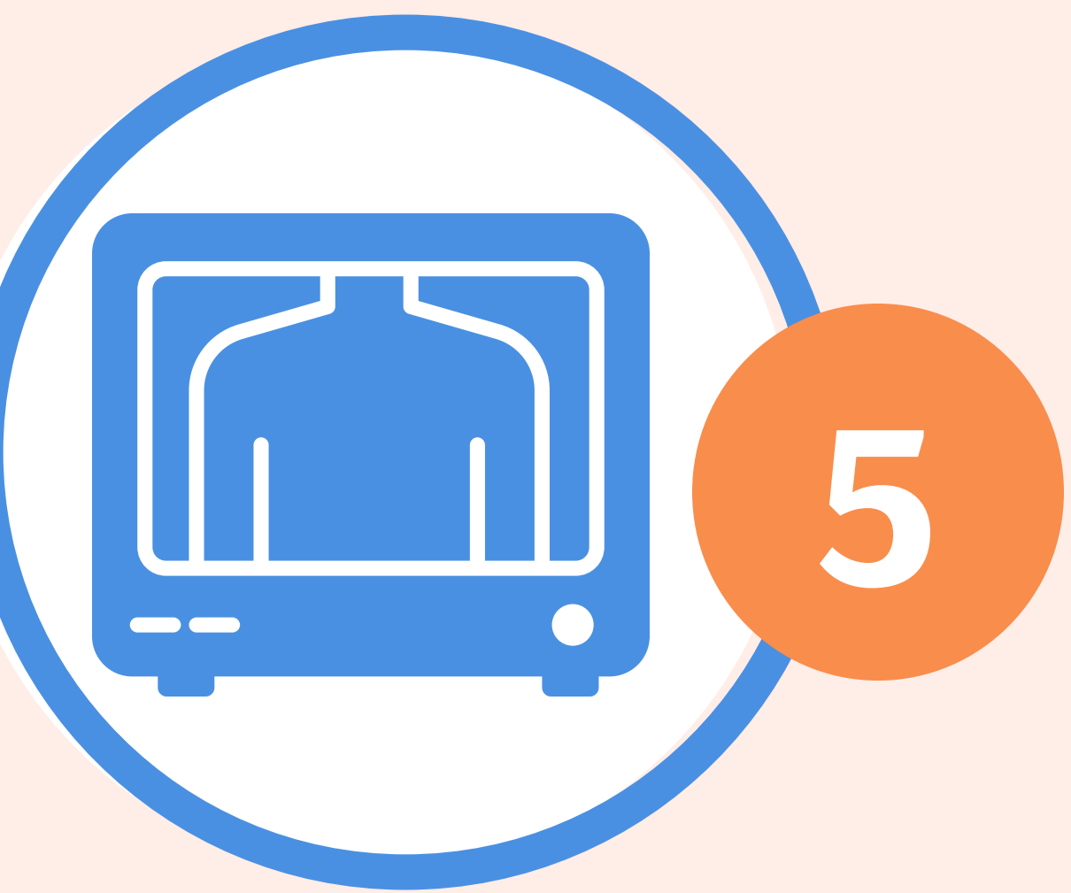
Image corporelle négative

Les personnes ayant vécu une agression sexuelle en enfance ont 80% plus de probabilités de rapporter de l'aversion sexuelle, tandis que celles qui ont vécu une agression sexuelle à l'âge adulte ont 2 fois plus de probabilités de rapporter de l'aversion sexuelle.